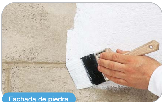
Fachada de piedra