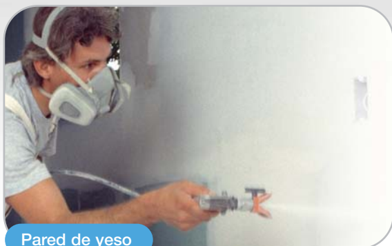
Pared de yeso