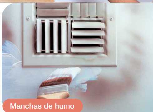
Manchas de humo