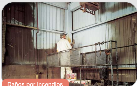
Daños por incendios